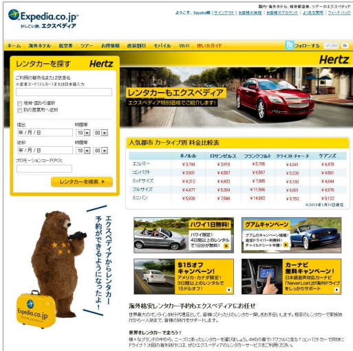
海外レンタカー予約画面