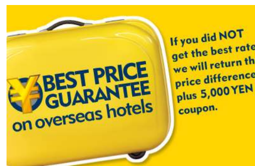
海外ホテル最低価格保証イメージ