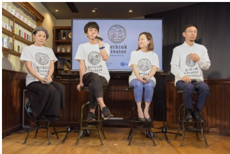
<トークセッションの様子①>

最後に、ゲスト 4 名から本プロジェクトに参加する人たちに向けて、応援メッセージを送っていただくと、会場からは拍手が起こり、イベントは終始穏やかな雰囲気で終了いたしました。