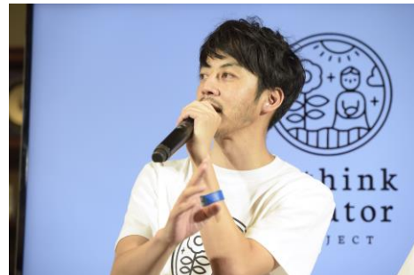
<トークセッションの様子②>