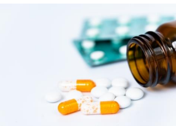
ミノキシジル・栄養剤