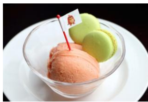
レッドの Sherbet & Macaroon セット