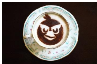
レッドのカプチーノ

映画『アングリーバード』の主人公レッドたちをモチーフとしたドリンクやフードを展開いたします。本メニューの提供時間は、14:30～21:00となります。