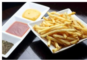
フレンチフライ ＜レッド&ポム&チャックの スペシャルフレーバー＞