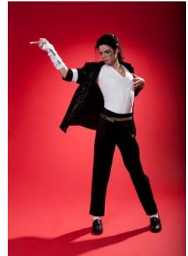
マイケル・ジャクソン等身大フィギュア