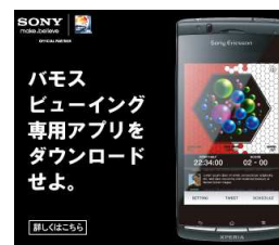
「バモれ。アプリ」イメージ