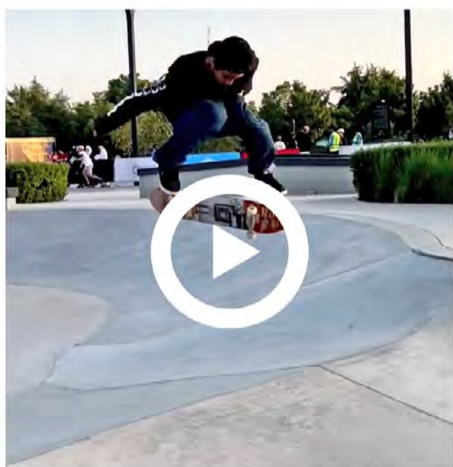
自身のスケートボード動画 （30秒以内）

（TIKTOK の場合は @Element_Skateboards をフォロー）