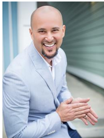
振付家 クリス・ジャッド