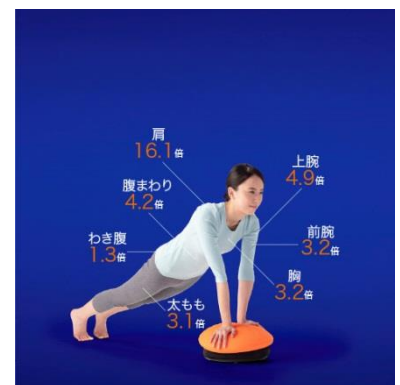
●ひじを伸ばし、腕立て

*慣れないうちは、体力に自信のない人は、足を床につけて使用してください。 *転倒に注意して使用してください。