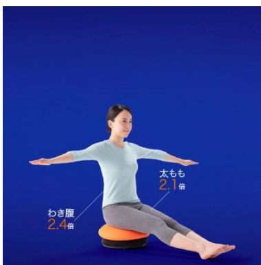
●腕を広げ、足を床に付ける