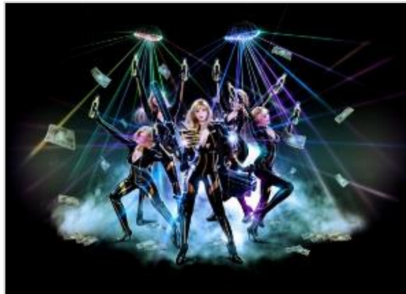
<HECATEダンサーズイメージ>

「デリハイ」とは、デリバリーハイテンションの略称で、テンションを上げたい人々に、テンションを上げたいタイミングで、テンションを上げたい場所へ、ハイテンションとHECATEをお届けする宅配サービスです。本サービスのために独自開発したウェアラブルパーティーデバイスを身につけたHECATEダンサーズが、忘年会の会場やパーティーをされるお宅、納会がある企業のオフィスなどを訪問し、ハイテンションとHECATEをお届けしながら盛り上がり必至のパフォーマンスを披露します。HECATEダンサーズが身につけるウェアラブルパーティーデバイスは、会場をディスコに変えるドローンミラーボール、超高水圧でパーティードリンクを浴びられるHECATEライフル、泡パを実現するバブルクラッカーバックパックなど、パーティーを確実に盛り上げる機能を実装しており、お客様と一緒にパーティーを盛り上げられるサービスとなっています。誕生日など何人かの仲間内での祝いでも、忘年会のような数十人規模の大パーティーでも、企業の会議室で行う納会でも、皆様の大切なパーティーを確実に盛り上げます。