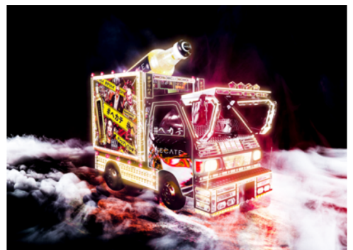
デリハイトラック

本デリハイサービスは、事前予約した方が 応募された日時に、指定された場所まで、 専用のデリハイトラックでお届けしていきます。