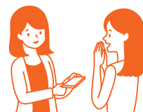
贈りたい相手にプレゼント