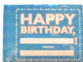
シュリンクを取る