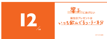
全50問の質問に 好きなメッセージを書き込む