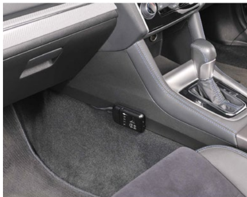
駐車監視用電源ボックス