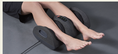
モード2 (ふくらはぎ用モード)