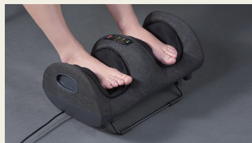
モード1 (足用モード)