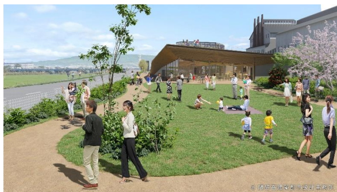
【芝生エリアイメージ】

本施設では、両社の強みを生かした自然環境や地域に前向きなアクションを実行していきます。その活動の一例として、両社の事業活動により排出されるコーヒー豆かすや焼酎粕を用いた「たい肥づくり」など、自然の恵みを体感いただけるワークショップを計画しています。できあがったたい肥で苗木を育成し、将来的には植林するなど、これらの活動を地域の循環に繋げてまいります。