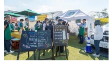
【昨年の秋まつり様子】

詳しくは「焼酎の里 霧島ファクトリーガーデン」ウェブサイトをご覧ください。 https://www.kirishima-fg.jp/202409/10812