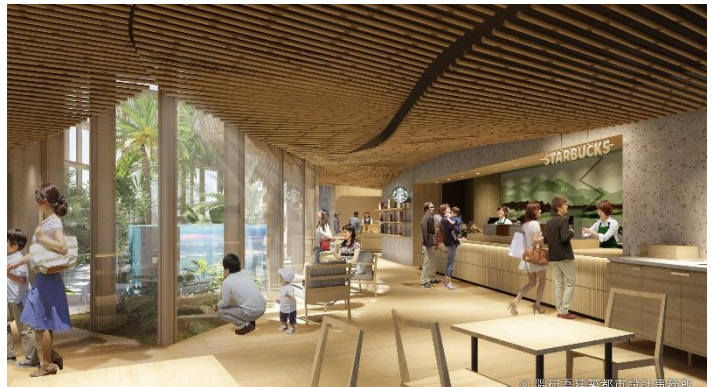
【施設内観イメージ】

施設の象徴となるガラス張りの植物園は、緑あふれる空間のなかで人と自然の関わりを体感できる場所です。「暮らしを支える植物」「味覚で楽しむ植物」「彩りを添える植物」「水と共に生きる植物」の4つのテーマに沿った、約80種類の亜熱帯植物が楽しめます。「味覚で楽しむ植物」のエリアでは、両社の商品を支える大切な原料である、コーヒーの木やさつまいもなどが育つ様子をご覧ください。「水と共に生きる植物」のエリアでは、水辺の植物とともに錦鯉が泳ぐ姿を見ることができ、水や緑、光が織り成す自然の豊かさを感じることができます。この植物園では、霧島酒造の焼酎を製造する過程で発生する蒸留温排水の熱エネルギーを活用することで、年間を通して、植物の様々な表情を楽しむことができます。さらに、本施設で利用する電力は「サツマイモ発電※100%」で運用する予定で、環境に配慮した施設運営を行ってまいります。