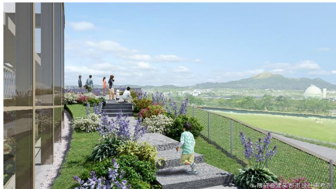
【屋上庭園イメージ】