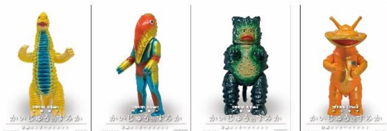
平日限定「かいじゅうソフビシール」イメージ