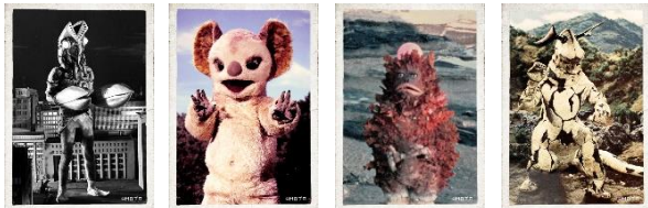
円谷プロ 大怪獣カード(全6種)