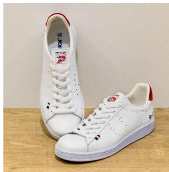
③パトリック ケベック ウルトラマンモデル