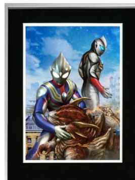
④丸山浩アートワーク