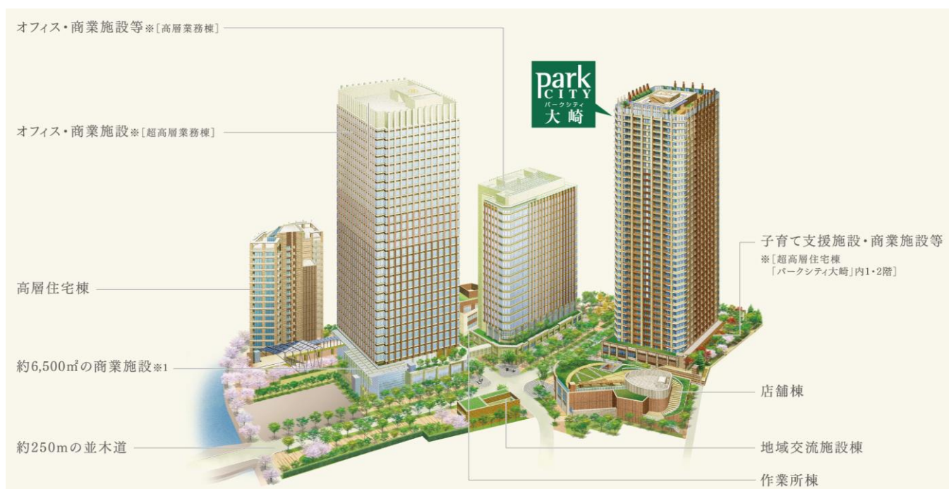
「北品川五丁目第1地区」全体完成予想イラスト

「パークシティ大崎」は、JR山手線内側で最大級(*1)となる約3.6haの開発面積を有するオフィス・商業施設・マンションが一体となった大規模複合再開発「北品川五丁目第1地区」のランドマークとして誕生予定、総戸数734戸・地上40階建てのタワーマンションです。経年優화를めざす環境創造型大規模開発住宅「パークシティ」ブランドとしてJR山手線内側で初(*2)となる「パークシティ大崎」は、都心の利便と緑溢れる環境の両立を図り、東京の新しい姿を未来へ届けることをめざします。