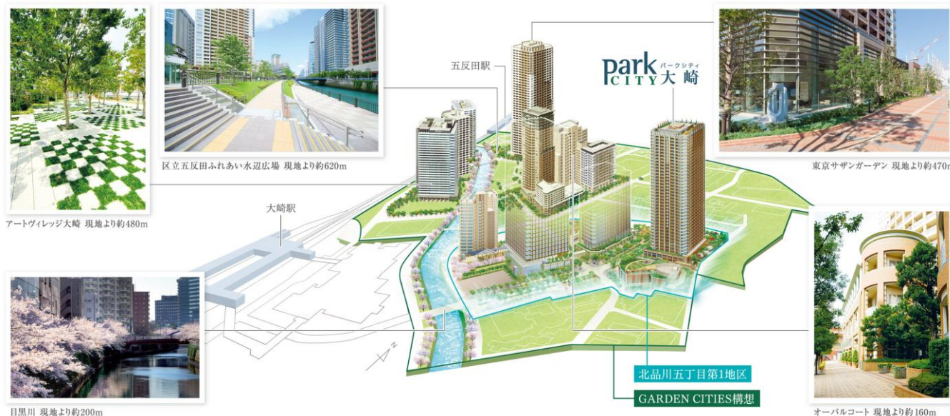
「GARDEN CITIES 構想」概念図

現在、大崎駅周辺エリアでは東京都副都心計画として開発面積約29ha（＊3）におよぶ大規模市街地再開発事業が進められています。昭和55年から始まったこのビッグプロジェクトは、“緑地空間の連続体となる街づくり”をコンセプトにした「GARDEN CITIES構想（＊4）」のもと「アーバンデザインガイドライン（＊5）」が策定され、街としてのまとまりに配慮した開発が進められてきました。「パークシティ大崎」が位置する「北品川五丁目第1地区」は、この大規模再開発のフィナーレを飾るフラッグシップ・プロジェクトとして開発が進められています。