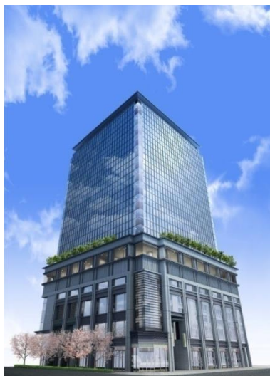
外観(イメージパース)

○1-5 街区北側の「江戸桜通り地下歩道」を中央区と共同で整備し、中央通りの地下拡幅国道事業と一体となって約 3,000m 2 の地下広場空間を整備。東京メトロ「三越前」駅、JR「新日本橋駅」や「三越日本橋本店」、「COREDO 室町」などと直結。災害には防災拠点となり、約 3,000 人を収容。