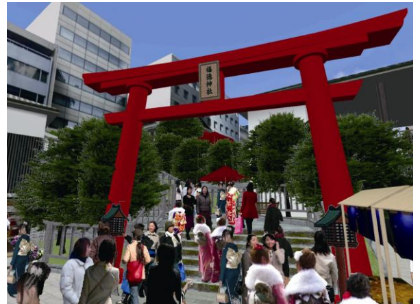
福德神社（イメージパース）