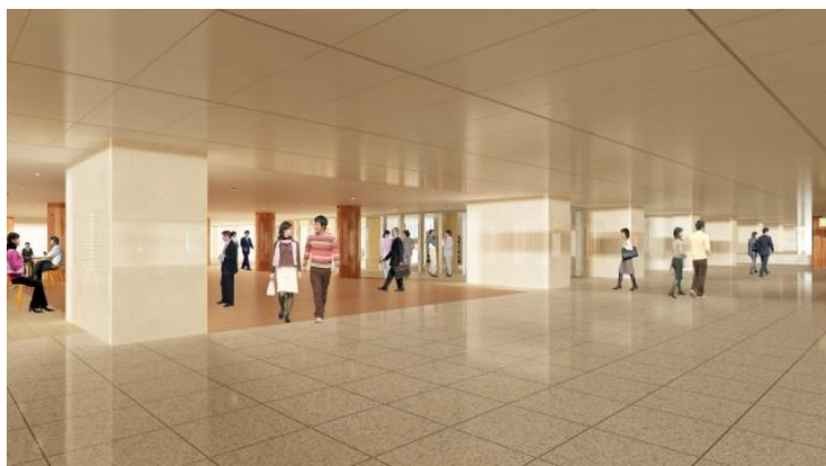
江戸桜通り地下歩道(イメージパース)