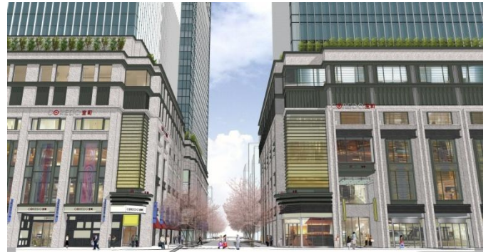
中央通り側（江戸桜通り入口）ファサード（イメージパース）