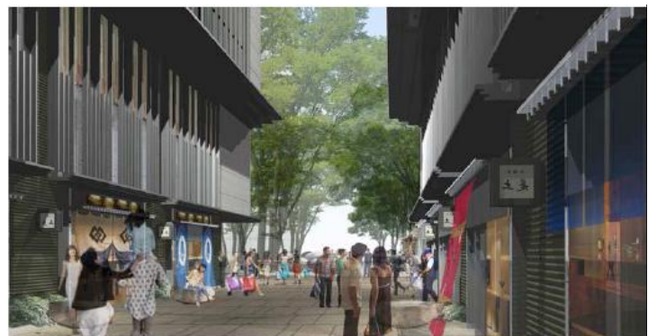
仲通り（イメージパース）