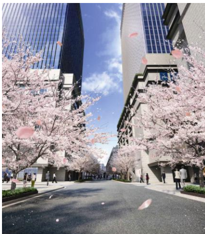
江戸桜通り側ファサード（イメージパース）