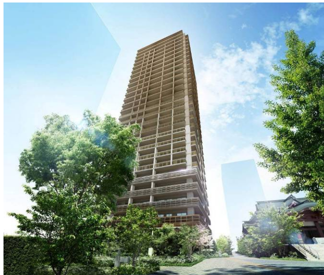
パークタワー西新宿エムズポート(外観完成予想 CG)

※「特別診察室」は、主任教授等の診察経験豊富な医師による診察・健康相談を行なうため開設された特別な診察室です(有料)。