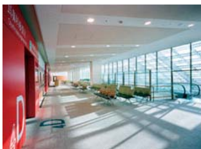
総合外来センター