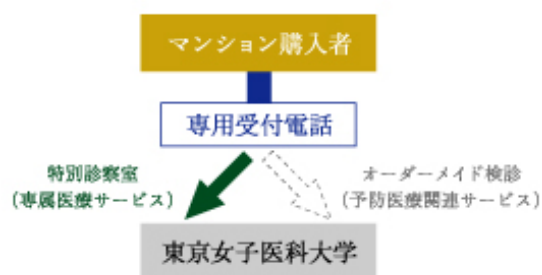
専属医療サービスの流れ

上記1、2を総合的に予防・診療を組み合わせたサービスを提供することで、お客様の健康で豊かな「暮らし」をサポートしていく予定です。