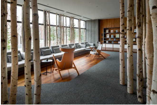
トラベルライブラリー（界 ポロト）

「界」に宿泊する年間50万人のお客様に、館内でも書籍を楽しんでいただけるように、全国の「界」に設置をします。ご当地の文化に触れることができる客室「ご当地部屋」や、紅茶やコーヒーなどの飲み物とともに本を楽しむことができる「トラベルライブラリー」などで滞在中様々なシーンで本書籍を手にとることができます。滞在中の施設の手業のひとつときを知ることや、次の温泉旅行の計画を立てるきっかけ作りとして楽しんでいただきたく、設置することにしました。