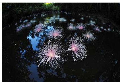
6月下旬～7月上旬に 花を咲かせるサガリバナ

サガリバナ、ジャングルの奥地の滝、ヤエヤマヒメボタルなど、西表島の魅力を生かしたイベントやアクティビティを開催しています。「日本最後の秘境」とも称される大自然の季節ごとの魅力を生かした、様々な体験を通して、世界自然遺産に登録された西表島の価値を感じられます。