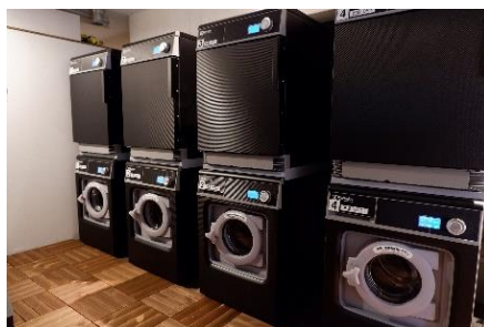
洗剤レスのスマートランドリー