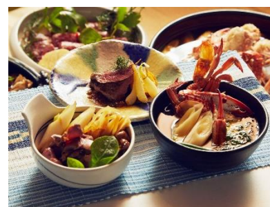
西表島で親しまれている食材を楽しめる料理