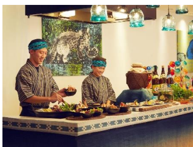
できたてを提供するライブキッチン