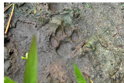
イリオモテヤマネコの足跡

イリオモテヤマネコをこよなく愛する島のナチュラルリストガイドと、イリオモテヤマネコの痕跡を巡るツアーです。フンや足跡、臭いなどの痕跡からイリオモテヤマネコの生態や、西表島の生態系について学びます。