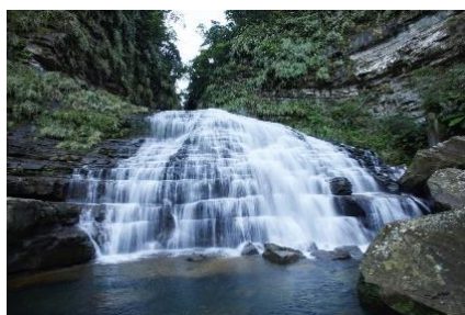
冬の雨量で水量を増す滝