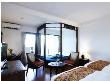
スーペリアツイン

客室タイプは、デイベッド付きやロフトタイプなど計3種類。139室を備え、西表島最大の客室数です。全室海に面しているなので、窓を開けると波の音や野鳥のさえずりが聴こえてきます。テラスから見える、神秘的な夕焼けや美しい星空は絶景です。