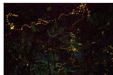
日本一早い2月から見られる ヤエヤマヒメボタル