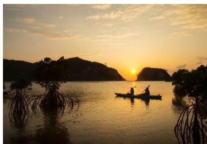
夕暮れマングローブカヤック

西表島ホテルでは、ホテルのすぐ目の前に、ジャングル、マングローブ林、珊瑚礁の海などの手付かずの自然が広がっています。西表島の醍醐味は、大自然のフィールドを制覇する様々なアクティビティです。ここでしか体験できないディープなアクティビティを楽しめます。