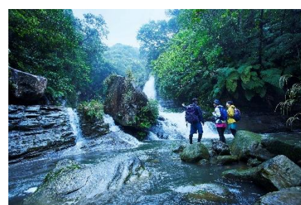
秘境ナララの滝へ ダイナミック西表島アドベンチャー