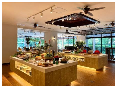
開放感のあるビュッフェレストラン

レストランでは、カマイ（イノシシ）やガザミ（ワタリガニ）、黒糖など、西表島で親しまれている食材を使用した料理を、ビュッフェスタイルで楽しめます。夕食では、あっさりとした味わいのカマイと黒糖の甘みが絶妙な「黒糖カマイすき焼き」。出汁が美味しい「ガザミ汁」。朝食では、きび糖や黒糖シロップを丸1日しっかりと漬けた「黒糖フレンチトースト」がおすすめです。