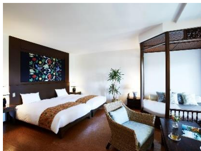
デラックスツイン