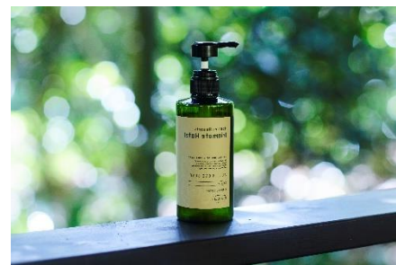
OSAJI と共同開発したオールインワンソープ