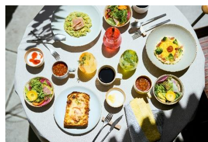
朝食利用イメージ