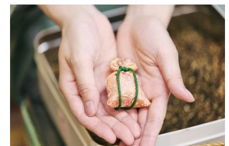
にはい袋専門店 石黒香舗