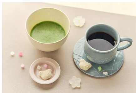
一服一煎セット イメージ