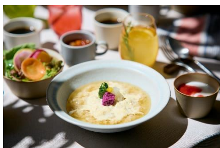
生湯葉漬物リゾット