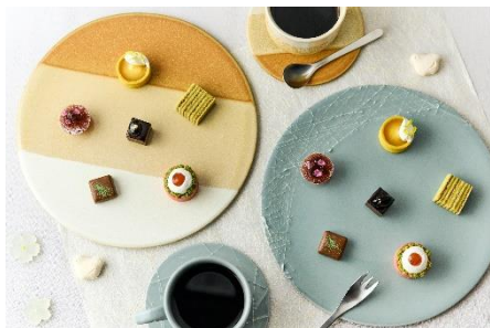
スイーツプレート Hassun