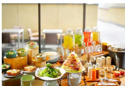
ビュッフェ台イメージ