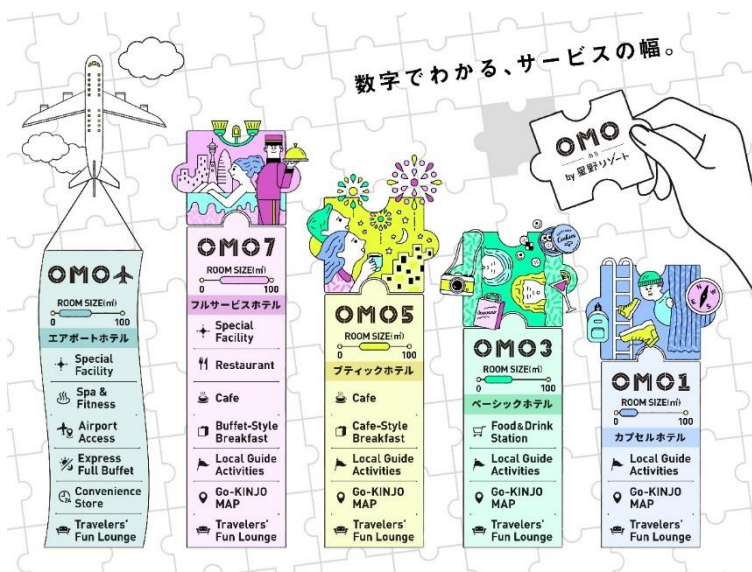
数字でわかる、OMOブランドのサービスの幅 イメージイラスト

施設名の OMO のうしろにある数字は、サービスの幅を表しています。この数字があることで、旅の目的や過ごし方に合わせて最適なホテルを選べます。お客様のさまざまなニーズに合わせ、都市観光の旅を OMO がサポートしていきます。