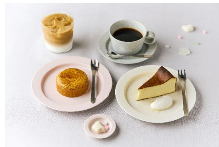
カフェメニュー 例