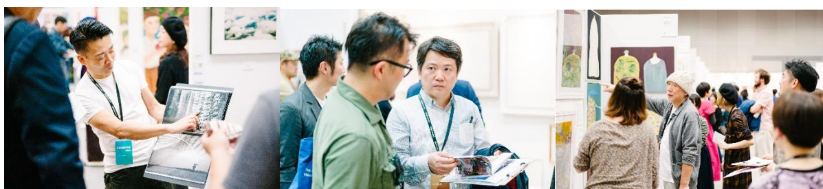
(UNKNOWN ASIA2017 の会場画像)

公式フェイスブック: https://www.facebook.com/unknownasia