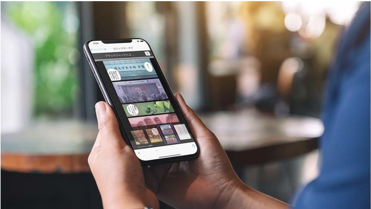
「読み放題プレイス™」使用イメージ(ブラックジャックによるしく 佐藤秀峰/画面ははめ込み合成です)

導入店舗へ来店中に雑誌やコミックが読み放題になるアプリ「読み放題プレイス™」を提供開始、待ち時間の楽しみを提供し、事業者の顧客接点獲得をサポート