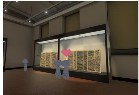
(左)VR 作品『洛中洛外図屏風 舟木本』 監修:東京国立博物館 制作:凸版印刷株式会社 (右)バーチャル特別展「アノニマス 一逸名の名画―」内の国宝「洛中洛外図屏風(舟木本)」展示の様子 Virtual Tohaku

また、バーチャル空間に開設した、バーチャル東京国立博物館(バーチャルトーハク)にて開催している、アニメーション映画「時をかける少女」とのコラボレーション企画 バーチャル特別展「アノニマス 一逸名の名画―」(2021年2月28日(日)まで開催)では、国宝「洛中洛外図屏風(舟木本)」が展示されています。ミュージアムシアターでの本 VR 作品の上演と、バーチャル空間上での文化財鑑賞の双方で、国宝「洛中洛外図屏風(舟木本)」の魅力や見どころをより感じる事が可能です。