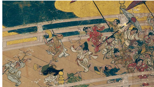
浮世を謳歌する人々のいきいきとした描写

滋賀県の舟木家に伝来し、現在は東京国立博物館が所蔵する国宝「洛中洛外図屏風(舟木本)」。六曲一双からなる屏風には、大坂夏の陣(1615年)によって豊臣家が滅びる直前の京都の様子と、そこに暮らす2,500人にもおよぶ各層各種の生命力に溢れた人々の姿が活写されています。実物鑑賞では小さく描かれ見えづらい花見席の重箱や、二条城の台所で鴨や鯛を調理する様子など、「食」を切り口に、屏風に描かれた京の人々の暮らしに触れます。わずか数センチのサイズで描かれた人物を300インチのスクリーンいっぱい超拡大するなど、高精細VRならではの方法で詳細に鑑賞できる作品です。