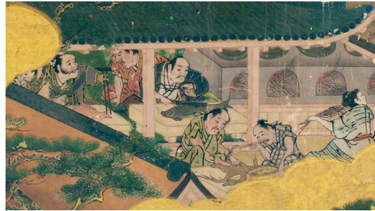
(左) 高密度に描き込まれた祇園祭の風景、(右) 二条城の台所で鴨や鯛を調理する様子