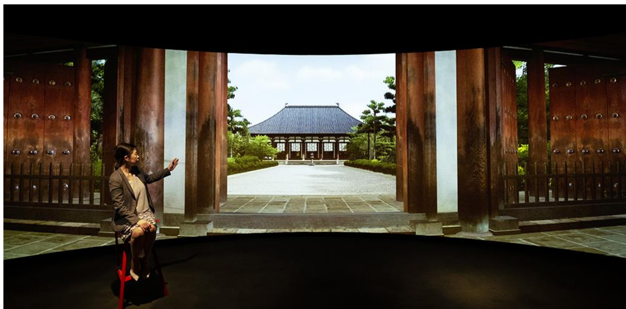
「Profound Tourism オンライン」ツアープログラム「奈良・唐招提寺のVR拝観」の様子 ※VR作品『唐招提寺』製作・著作:凸版印刷株式会社/TBS 監修:鈴木嘉吉・大山明彦 協力:唐招提寺 データ提供:独立行政法人 情報処理推進機構 先導的アーカイブ映像製作支援整備事業より

なお、先行販売プログラムは「奈良・唐招提寺の VR 拝観」と「東京・浮世絵工房のバーチャル見学」の2ツアーとなります。