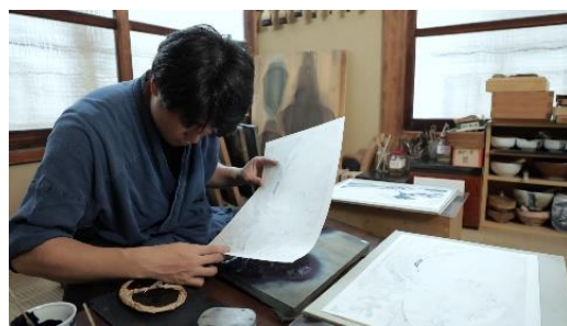
「東京・浮世絵工房のバーチャル見学」の様子

上記2ツアーは先行販売商品となります。今後も「京都・町家での洛中洛外図屏風デジタル鑑賞」や「東京・禅寺でオンライン座禅」など、新規ツアーの開発・販売を予定しています。