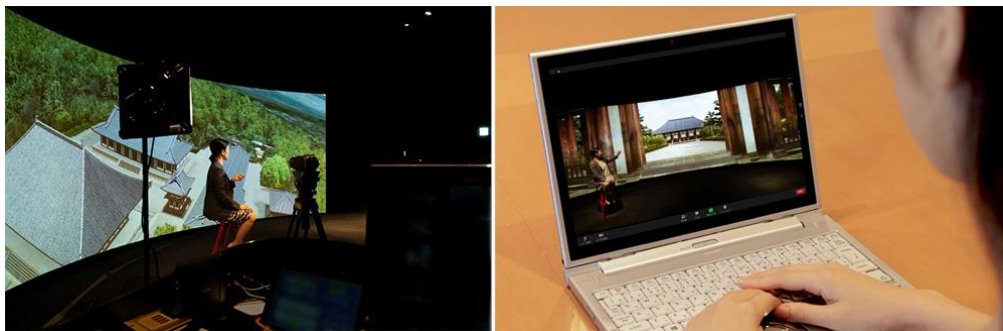
VRスタジオからのリアルタイム配信の様子

3面カーブ式スクリーンを使った奥行き感あるスタジオ中継で、VR等の最先端映像を体験。日本文化の世界に浸る没入体験と、現地にいるかのような臨場感を味わうことができます。