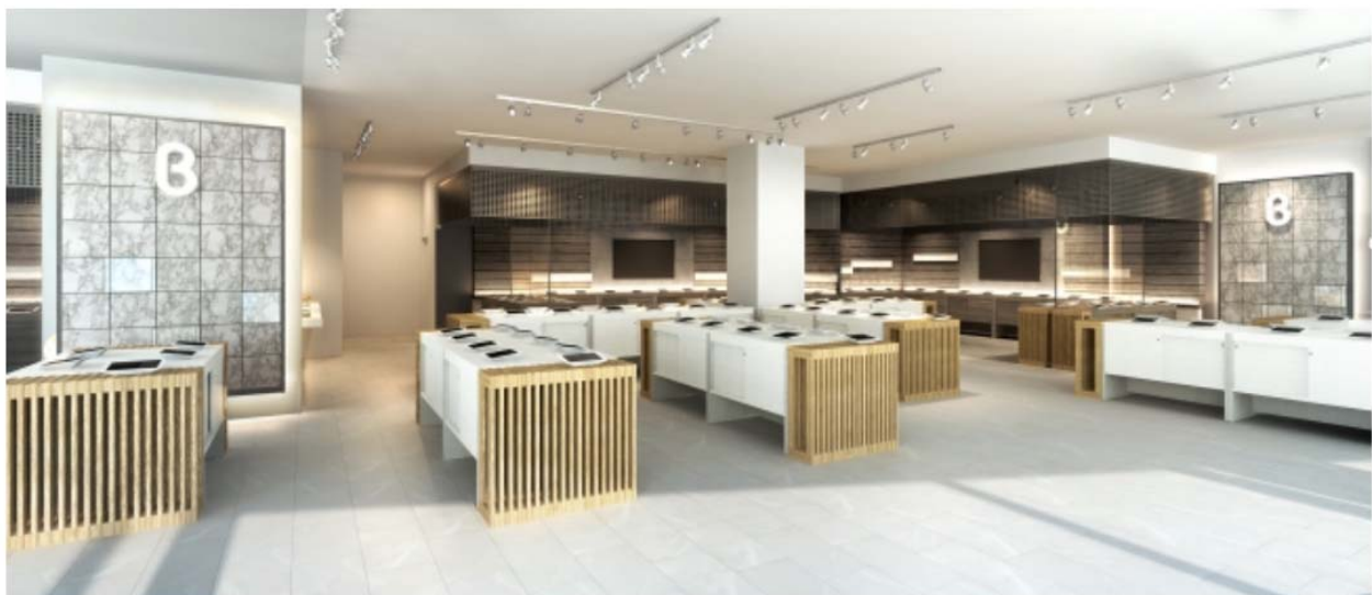
b8ta Tokyo - Yurakucho 店舗イメージ

なお、凸版印刷は、米国の b8ta,Inc への出資を通じてベータ・ジャパン合同会社と協業しています。本協業を通じて、凸版印刷が持つ小売りやメーカーにおける店頭ソリューション提供実績や顧客基盤、データ分析によるマーケティング支援実績を活用した b8ta 店舗、および日本市場における出店者の開拓支援や RaaS における日本市場拡大の推進も引き続き行っていきます。