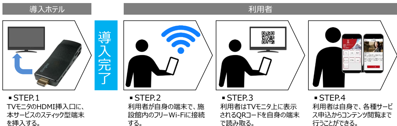
サービス導入フロー

本サービスは「旅道®プラットフォーム」と連携しており、ホテルをハブにして様々な地域情報を発信します。利用者は、地域に最適化されたご当地グルメ情報、近隣観光地の見所やクーポンを「旅道®アプリ」がインストールされた自身の端末で持ち歩くことができ、これまでにないホスピタリティを提供することが可能です。ホテルを新たな観光発信拠点へと導く、次世代型プラットフォームです。