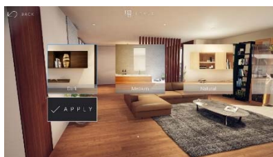
インテリアスタイル一括変更画面