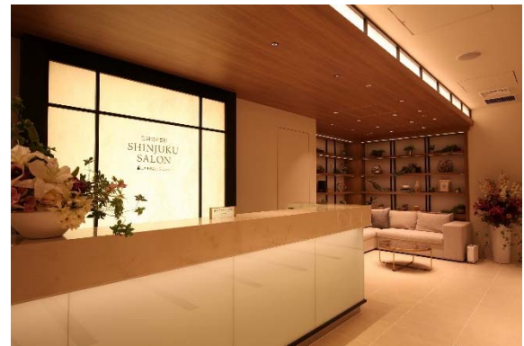
三井不動産レジデンシャル 「三井のすまい 新宿サロン」