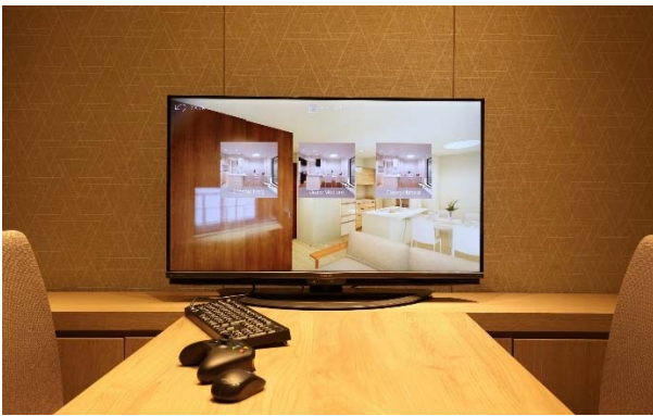
「トッパンバーチャルモデルルーム」利用シーン

このたび本システムが、三井不動産レジデンシャル株式会社(本社:東京都中央区、代表取締役社長:藤林清隆、以下 三井不動産レジデンシャル)が運営する分譲マンション販売センター「三井のすまい 新宿サロン」にて販売される新物件「パークホームズ中野本町 ザ レジデンス(売主:三井不動産レジデンシャル、東レ建設株式会社)」(※1)の住宅内部提案ツールとして採用、2019年8月より運用が開始されます。