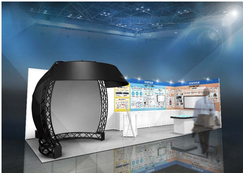
「自治体総合フェア 2019」凸版印刷ブースイメージ

地域の活性化を企画・実施から効果検証まで一貫して提供し、地域の魅力創出に貢献するソリューションを提案します。