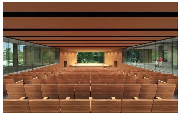
レクチャーホール