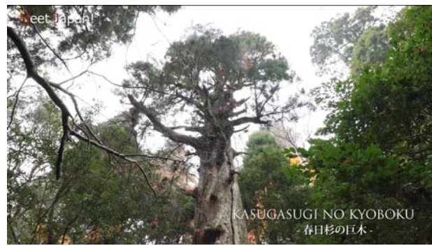
オリジナル高品質 4K 映像コンテンツ「春日山原始林」