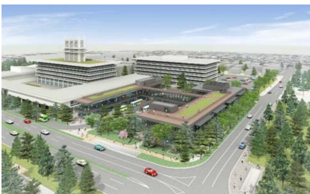
奈良公園バスターミナルの完成イメージ図