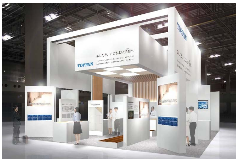
「JAPAN SHOP 2019」凸版印刷ブースイメージ

多彩な建装材とソリューションを掛け合わせて、「人が賑わい、楽しみ、快適に過ごせる空間づくり」を提案します。