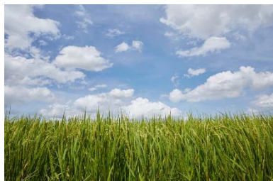
田園風景(川越藩のお蔵米)

なお川島町は凸版印刷が運営する日本の食文化情報発信サイト「SHUN GATE®(シュンゲート)」を通じて、川島町が有する地域資源をストーリー化し、ウェブやイベントなどを活用して多角的に発信するプロモーションを2018年6月より行っており、本イベントはその一環として実施するものです。