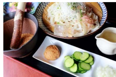
郷土料理 すったて

川島町が「SHUN GATE」で発信している川島町魅力の一部( https://shun-gate.com/kawajima/ )