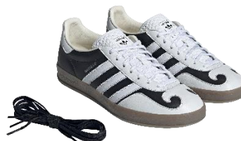
GAZELLE INDOOR (IH9989) 自店販売価格 ¥26,400 (税込)