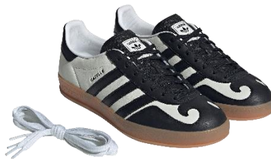
GAZELLE INDOOR (IH9990) 自店販売価格 ¥26,400 (税込)