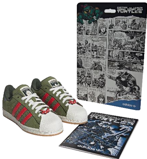
TMNT SHELLTOE (IF9280) 自店販売価格 ¥19,800 (税込)

リニューアルオープンに合わせ、「ティーンエイジ・ミュータント・ニンジャ・タートルズ」とのコラボレーションモデルや、CITY OF SEOULプロジェクトの第一弾、韓国の伝統的なシューズのデザインを落とし込んだ「GAZELLE GATSIN」などの限られた店舗のみでしか取扱いのない注目商品を揃えています。