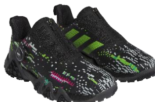
コードカオス 22 ボア