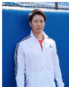
ADIZERO AFTERBURNER 8 着用