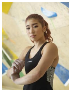
FIVE TEN HIANGLE 着用

「今シーズン着用しているアフターバーナー8に新しいカラーが出ることに嬉しく思います。僕も気に入っているモデルなので、皆さんもこれを履いてスポーツを楽しんでくれたら嬉しいです」