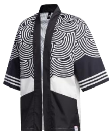
M HTC HAPPY ジャケット

アディダスでは初の法被ジャケットや浴衣ジャケット、キッズ用甚平など、日本限定アイテムと共に全89品番（内アパレル44品番、アクセサリ-15品番、フットウェア26品番、ゴルフアパレル4品番）を展開。6月11日より発売開始。