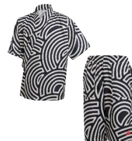
HTC JINBEI ST Y