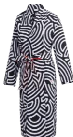
W HTC YUKATA ジャケット