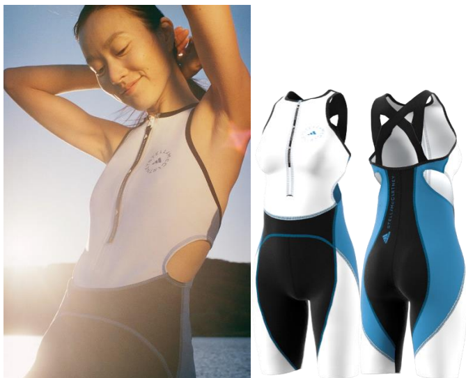
品番 : GQ1209, カラー:ストームブルー/ブラック/ホワイト

大胆なカラーブロックデザインを採用した、ユニークかつ多機能なこの多目的トライスーツは、サポート力のあるフィット感と肌触りで、ランニングやスイミング、トライアスロンにおすすめの一着です。ヴェントシューズ同様、PRIMEBLUE(プライムブルー)を使用。