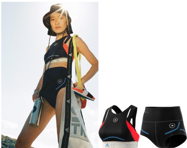
TOPS - 品番 : H13257, カラー : ブラック/ビビットレッド BOTTOMS - 品番 : GL7617, カラー : ブラック

スタイリッシュかつフェミニンながらサポート力のあるこのビキニセットは、陸上から水中へと移動するアスリートにフィット感を提供。トップスはレーサストラップでサポート力を高め、ボトムスはミディアムウエストで快適なはき心地を実現。どちらもカラーブロックデザインが特徴的で、海洋汚染の心配なくビーチで思うままに過ごせるスイムウェア。トップスにもボトムスにも、ヴェントシューズとトライスーツ同様、PRIMEBLUE(プライムブルー)を使用しています。