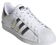
SUPERSTAR W (FW3915)