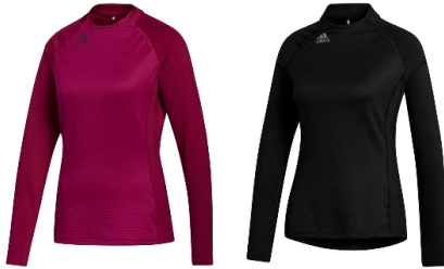
【COLD.RDY 長袖モックカラーシャツ】 7,990 円