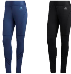
【COLD.RDY レギンス】 7,490 円