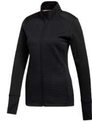
【COLD.RDY 長袖フルジップレイヤリング】 9,9000 円