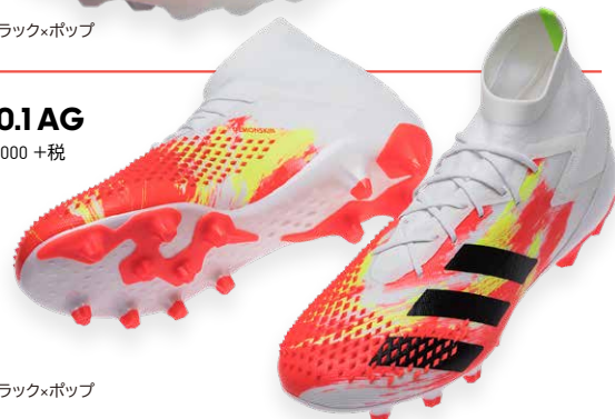
商品番号 EG1623 フットウェアホワイト×コアブラック×ポップ

プレデター 20.1 AG ¥22,000 +税 サイズ / 24.5~29.5cm 6月3日(水) 発売予定 ※一部店舗のみ取り扱い