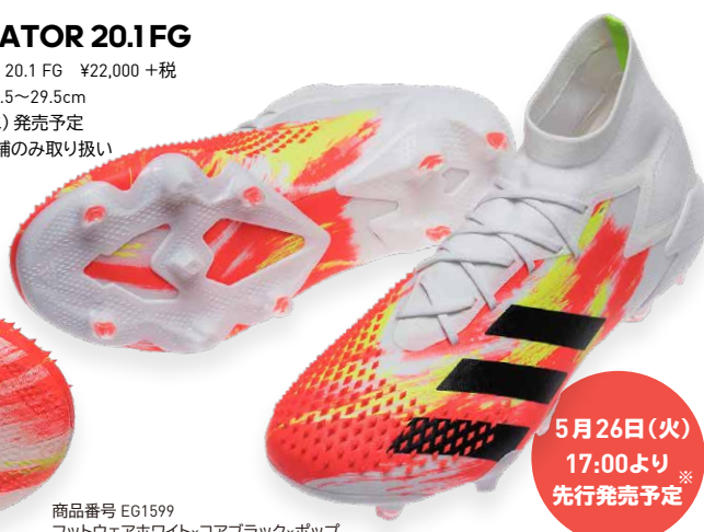
商品番号 EG1599 フットウェアホワイト×コアブラック×ポップ

■ Controlframe スプリット型のアウトソールを搭載し、自然な動きをサポート