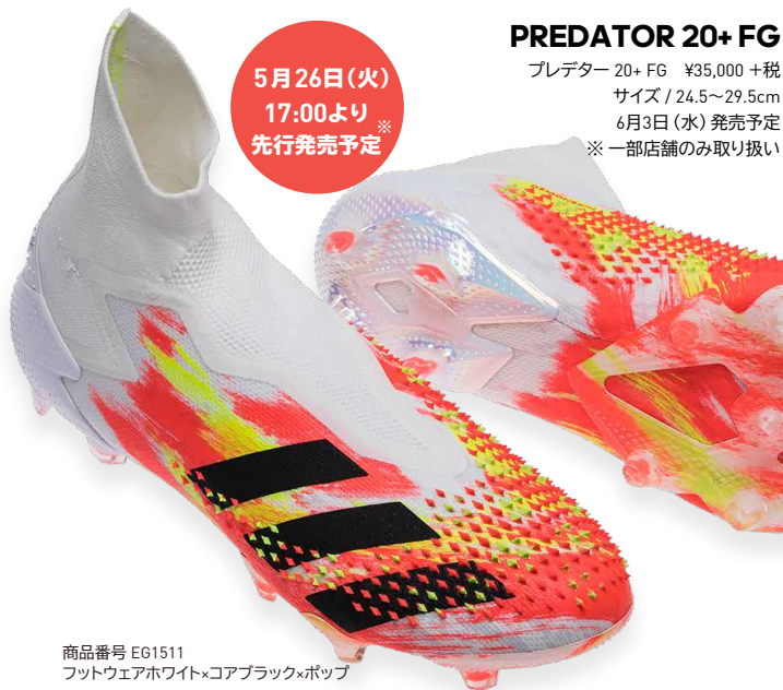
商品番号 EG1511 フットウェアホワイト×コアブラック×ポップ

プレデター 20.1 FG ¥22,000 +税 サイズ / 24.5~29.5cm 6月3日(水) 発売予定 ※一部店舗のみ取り扱い