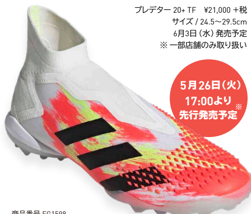
商品番号 EG1598 フットウェアホワイト×コアブラック×ポップ

プレデター 20+ TF ¥21,000 +税 サイズ / 24.5~29.5cm 6月3日(水) 発売予定 ※一部店舗のみ取り扱い