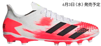
商品番号 FV3199 フットウェアホワイト×コアブラック×ポップ

プレデター 20.2 HG/AG ¥15,000 +税 サイズ / 24.5~29.5cm 6月3日(水) 発売予定