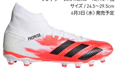
商品番号 EG0912 フットウェアホワイト×コアブラック×ポップ

プレデター 20.3 HG/AG ¥8,990 +税 サイズ / 24.5~29.5cm 6月3日(水) 発売予定