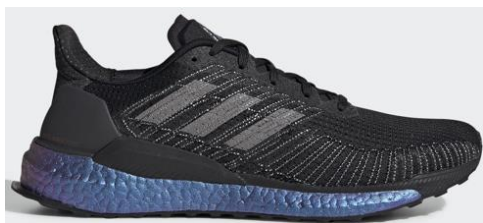
商品番号 : EG2363 コアブラック/コアブラック/ソーラーレッド