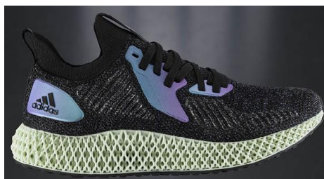
商品番号 : FV6106 コアブラック/グローリーブルー/カレッジパープル