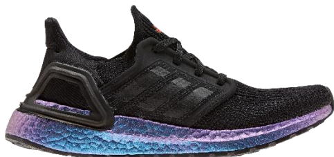
商品番号 : EG4807 コアブラック/コアブラック/ブーストブルーバイオレットメタリック