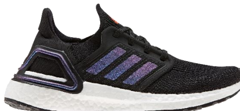
商品番号 : EG4861 コアブラック/ブーストブルーバイオレットメタリック/フットウェアホワイト

©2019 adidas Japan K.K. adidas, the 3-Bars logo and the 3-Stripes mark are trademarks of the adidas.