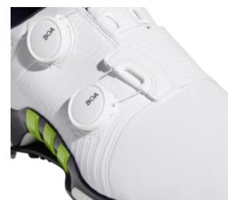
前足部の裏から甲上までぐるりと包み込む FORGED360WRAP