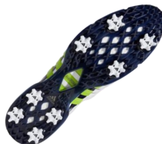
全方向に対する高いグリップ力を誇る X-Traxion8 クリートアウトソール