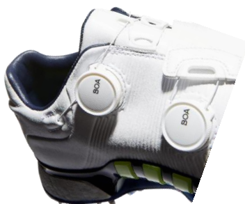
メインダイヤルは前足部のホールド感を、セカンドダイヤルは足首周りのフィット感を調整

更に、ゴルフの動きに適した方向・度合にストレッチが効くよう、アディダス独自のフォージド加工(熱加工)をアッパーの人口合成皮革に直接施しました。使用する素材を少なく抑えることにより、2つの Boa ダイアルや8つのクリートを搭載しているにも関わらず、前モデルと同等の450g(25.5cm)という軽さと快適な履き心地を担保しています。