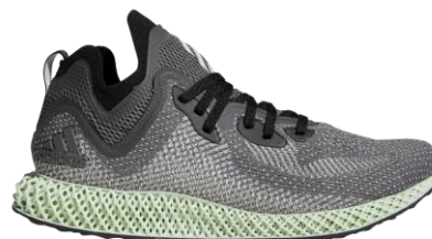
アディダス ブランドスコアストア 新宿 50 足限定販売