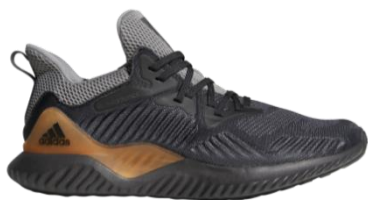
商品番号 CG4762 グレーフォアF17/カーボン S18/DGH ソリッドグレー

アルファバウンス ビヨンド ¥11,000+税 サイズ: 24.5cm~35.5cm