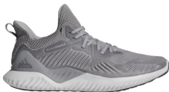
商品番号 CG4765 グレーTWO F17/グレーTWO F17/グレーワンF17