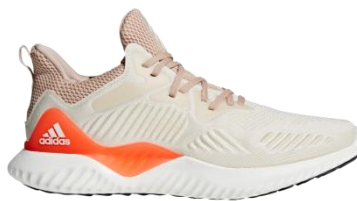
商品番号 CG4763 リネンS17/チョークホワイト/アッシュパールS18