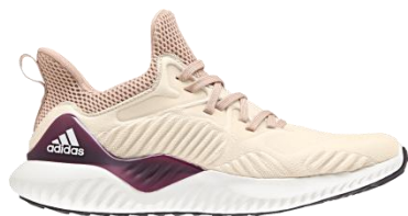
商品番号 DB0206 エクリュティントS18/アッシュパールS18/アッシュパールS18

アルファバウンス ビヨンド ¥11,000+税 サイズ: 22.0cm~29.0cm