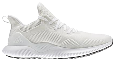
商品番号 AC8274 ランニングホワイト/シルバーメット/ランニングホワイト