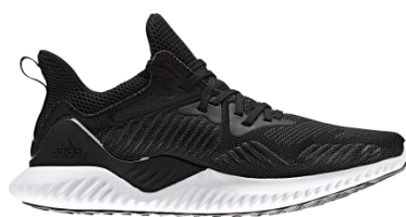
商品番号 AC8273 コアブラック/コアブラック/ランニングホワイト