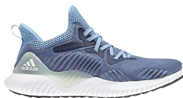
商品番号 DB0205 ノーブルインディゴS18/ノーブルインディゴS18/アッシュブルーS1