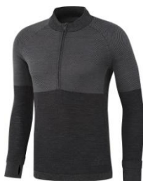
ウルトラ クライマヒート ハーフジップシャツ M

¥14,000 + 税 サイズ / XS, M, O, 2XO, 4XO, 6XO