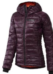
W クライマヒート アグラビック ダウンジャケット

¥35,000 + 税 サイズ / XS, S, M, L, O, XO, 2XO