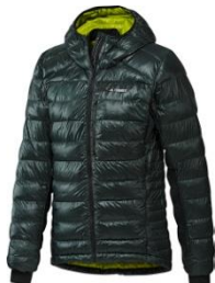
クライマヒート アグラビック ダウンジャケット

¥35,000 + 税 サイズ / XS, S, M, L, O, XO, 2XO