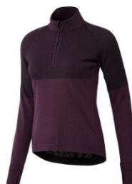
ウルトラ クライマヒート ハーフジップシャツ W

¥14,000 + 税 サイズ / XS, M, O, 2XO, 4XO, 6XO