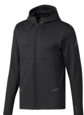
M4T トレーニング クライマヒート ジップアップジャケット

¥12,000 + 税 サイズ / 2XS, XS, S, M, L, O, XO, 2XO