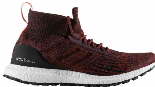
商品番号 S82035 / ダークバーガンディ × ダークバーガンディ × エナジー

ウルトラブースト オールテレイン ¥24000 +税 サイズ / 23.5 ~ 31.0cm