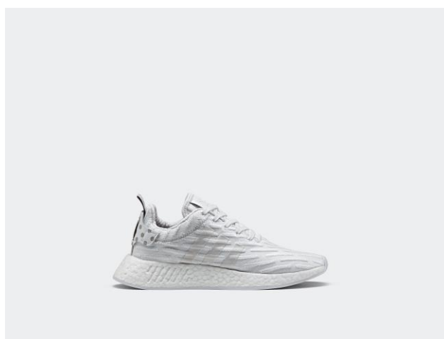
NMD_R2 PK W BY2245 ¥16,000 +税(自店販売価格)