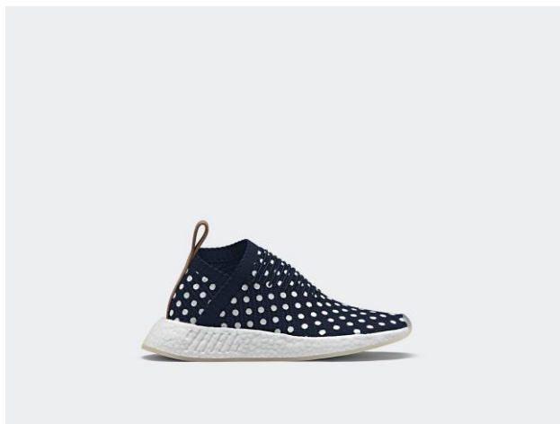
NMD_CS2 PK W BA7212 ¥25,000 +税(自店販売価格)